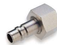
Zástrčka - vnitřní závit