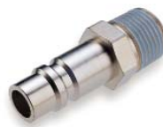
Zástrčka - vnější závit