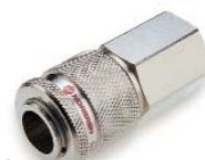
Zásuvka - vnitřní závit