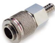
Zásuvka - hadicový adaptér